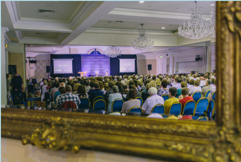
Féile Hay, Ceanannas Meitheamh 2013

Tharraing Féile Hay ionann is 10,000 cuairteoir ar Ceanannas i mí Meithimh, go leor díobh ó thar lear agus beidh an imeacht ealaíon íocónach idirnáisiúnta agus litríochta seo ar bun arís in 2014. Fuair an fhéile deontas Tóstail de €10,000 mar thacaíocht.