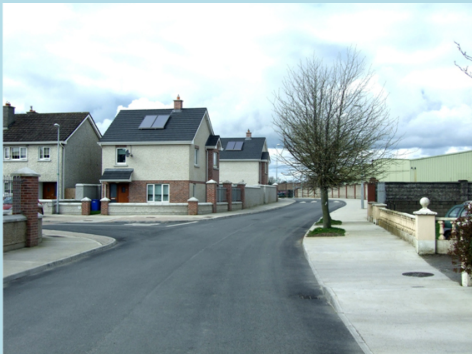
Scéim Athchóirithe Páirceanna Súgartha

Tá beartas tithíochta á athrú ó thógáil agus ó fháil thraidisiúnta tithíochta go dtí foinsí eile soláthair, ina measc léasú fadtéarmach, Scéim Cóiríochta Cíosa (RAS), agus Comhlachtaí Ceadaithe Tithíochta tríd an Scéim Cúnaimh Caipitil srl, agus mar thoradh air sin, tá laghdú tagtha ar leithdháileadh Caipitil le blianta beaga anuas. Dúshlán ollmhór don Údarás Tithíochta é sin. Ina ainneoin sin, áfach, bhí Roinn Tithíochta Chomhairle Contae na Mí in ann roinnt tionscadal a bhrú chun cinn in 2013.