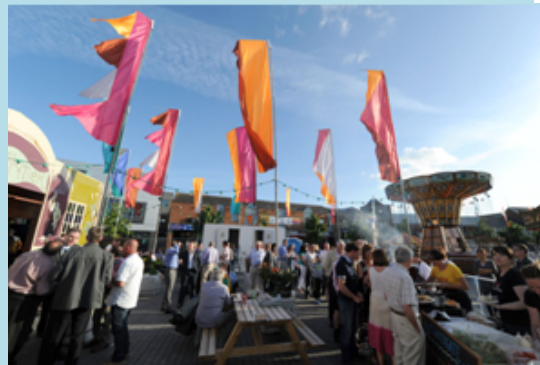
Féile Speigeltent na hUaimhe 2013