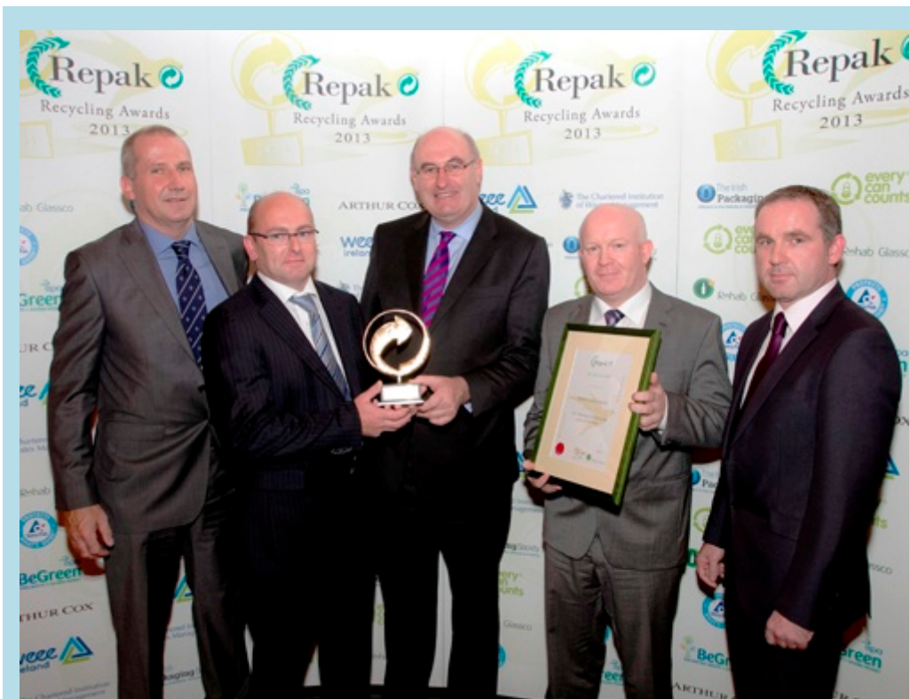
Bronnadh Ionad Repak Athchúrsála/Conláiste Cathartha na bliana ar Shuíomh Conláiste Cathartha Bhaile Átha Troim