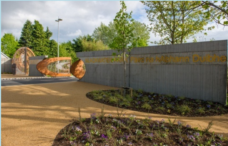
Páirc na hAbhann Duibhe