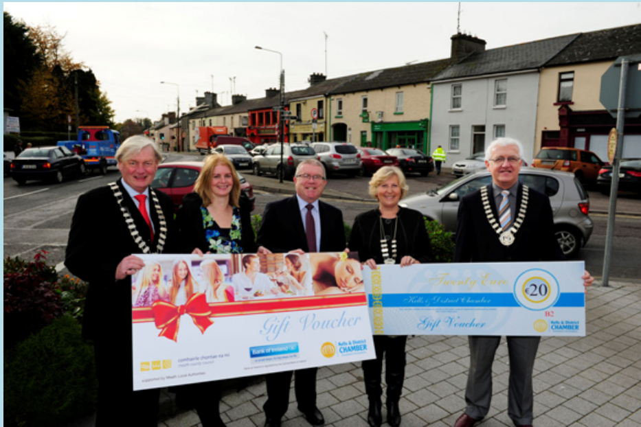
Seoladh Thionscnamh Dearbháin Bronntanais Cheannais, Samhain 2013

Leanadh leis an bhfeachtas margaióchta Make It...Meath le linn 2013, agus tugadh Bróisiúir Deiseanna Eacnamaíocha Make It... Bhaile Átha Troim, Dhún Seachlainn, Dhún Búinne/ Clonee agus na Mí Thoir chun críche.