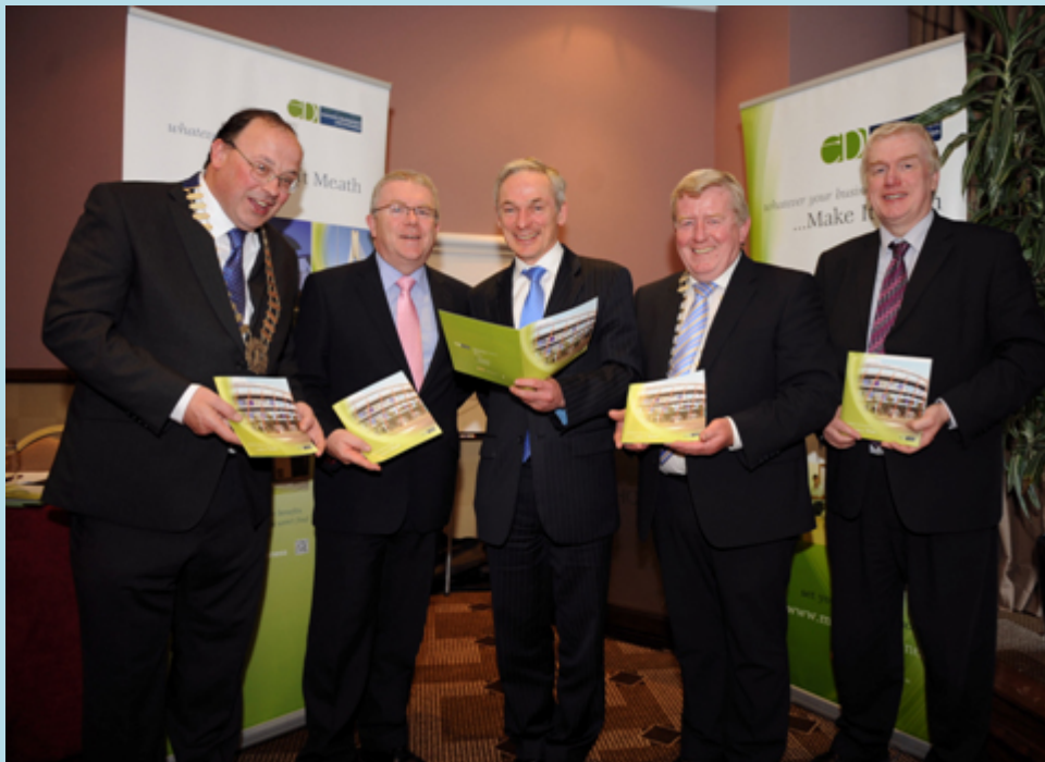
Seoladh Bhróisiúr Deiseanna Eacnamaíocha Make It Bhaile Átha Troim (Bealtaine 2013)