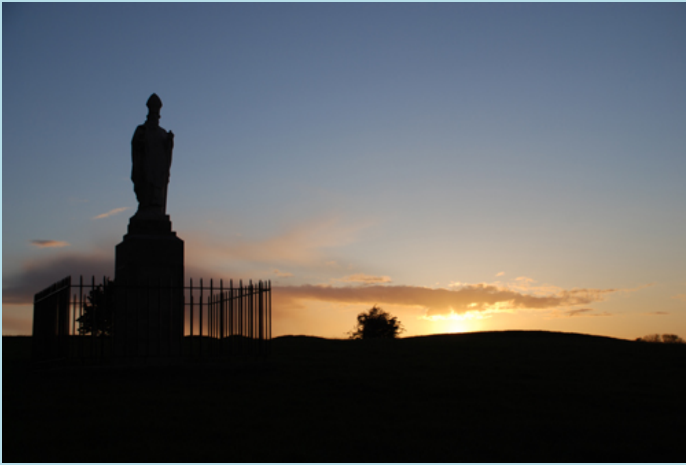
Cnoc na Teamhrach