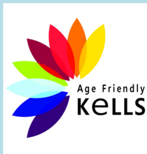
Seoladh Scéim Aitheantais Gnó Aoisbhách Ceanannais 2013

Bhí béim ar an Tóstal le linn 2013 agus tugadh tacaíocht maoinithe d'os cionn 50 imeacht Tóstail aonair.