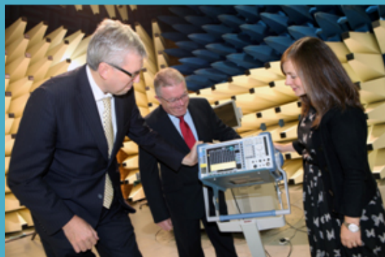
Seoladh Life Sciences Supply Chain 2013

Tá tacaíocht á tabhairt don earnáil Miondíola trí thionscnamh píolótach 'Scéim Aitheantais Gnó Aoisbhách' atá á thriail i gCeanannas i gcomhpháirtíocht leis an gComhlachas Tráchtála agus le hÉire Aoisbhách. Cuirfear an tionscnamh i bhfeidhm i mbailte eile nuair a thiocfaidh deireadh leis an tionscnamh píolótach in 2014.