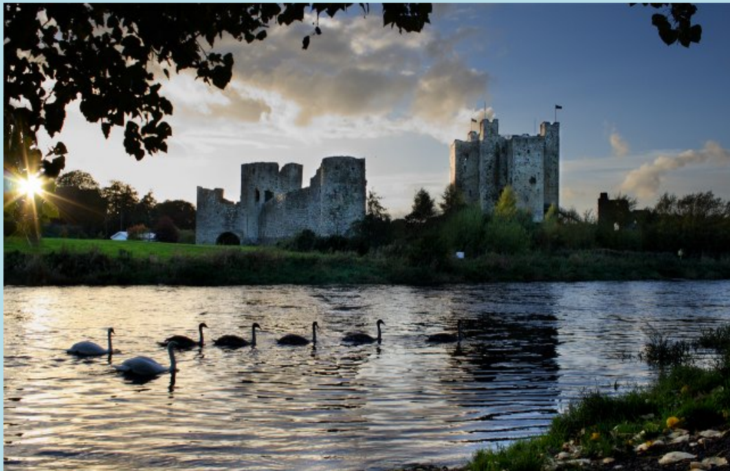
Caisleáin Átha Throim