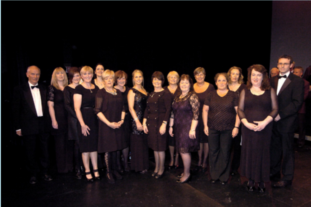
Cór Chomhairle Chontae na Mí