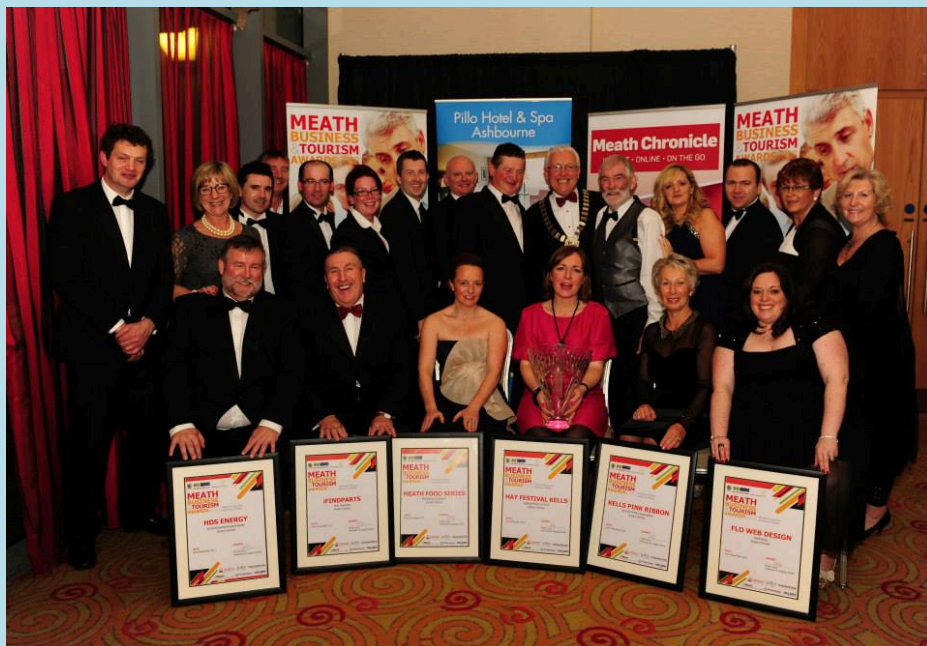
Dámhachtainí Gnó & Turasoireachta na Mí 2013 - Buaiteoirí

Fógraíodh roinnt jabanna sa chontae in 2013, lena n-áirítear Alltech, HDS Energy, Mafic Blach Basalt Ireland agus Hanley Engineering. Bhí roinnt táscairí dearfacha san earnáil miondíola le 20 gnó nua bunaithe i gCeanannas leis féin le linn na bliana.