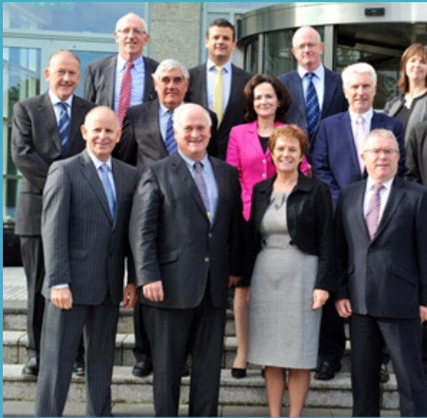
Comhaltaí an Fhórait Eacnamaíoch 2013

Bunaíodh Fóram Eacnamaíoch ar a bhfuil 11 chomhalta deonacha in 2013, agus tháinig an Fóram le chéile ar dhá ócáid le linn na bliana. Ina theannta sin, chuir comhaltaí an Fhórait iad féin ar fáil ar bhonn aonair chun comhairle a thabhairt ar ghnéithe faoi leith den Straitéis Eacnamaíoch bheartaithe.