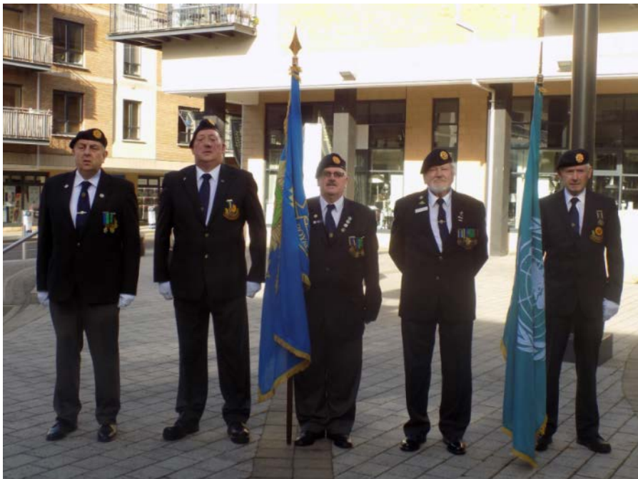
Fáiltiú Cathartha Thomáis Ághais (grianghraf thíos)