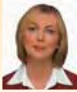
Regina Doherty (F.G.)