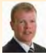
Peadar Tóibín (S.F.)